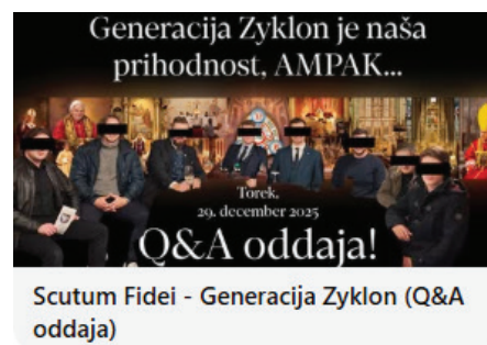
Scutum Fidei - Generacija Zyklon (Q&A oddaja)

Odgovor: Pokojnine so pravica, a mladi potrebujejo pogoje za življenje zdaj. Sistem mora podpirati mlade in družine, ne pa jih dušiti. Če mlad človek ne more do stanovanja, normalne plače in varnosti, potem prihodnost države nima temelja. Ne more biti vse pos-