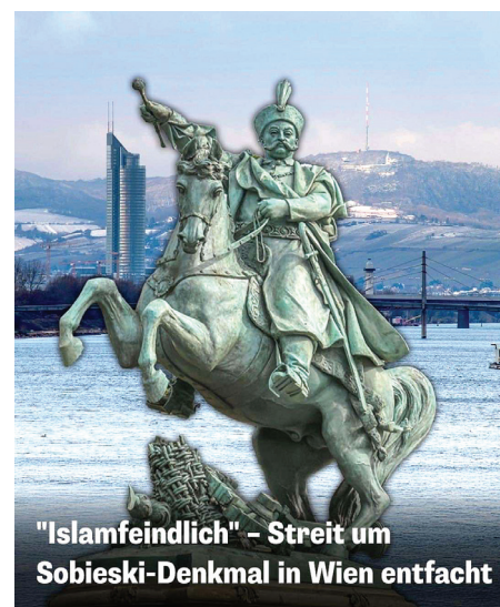
"Islamfeindlich" - Streit um Sobieski-Denkmal in Wien entfacht

To ni naključje. To je del širšega trenda, kjer se evropske narode sili v pozabo lastne identitete. V imenu »inkluzije« brišemo simbole, ki nas spominjajo na naše zmage, naše junake, našo kulturo. Slovenija ni daleč od tega: če se ne upremo, nas čaka enako. Naši predniki so se borili pro-