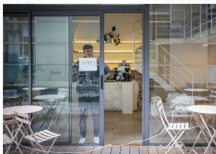
Domače gostilne umirajo, raste pa dostava hrane. Kdo ima korist? Globalisti, tujci!

A tukaj je še ena pomembna resnica, o kateri se premalo govori. Generacija bumerjev, ki je ustvarila marsikatero gostilno, delavnico ali družinsko podjetje, je svoje otroke desetletja pošiljala predvsem v šole in na fakultete. Sporočilo je bilo jasno: študiraj, da ti ne bo